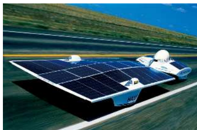
野村仁《サンストラクチャー '99》 1998-1999年